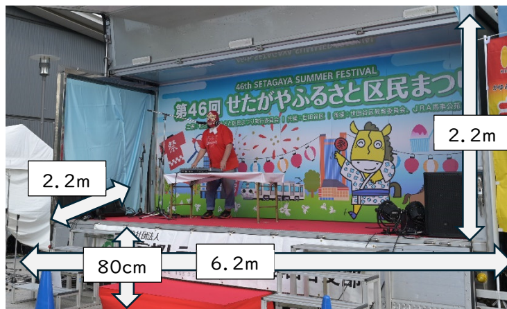
【トラックステージ】