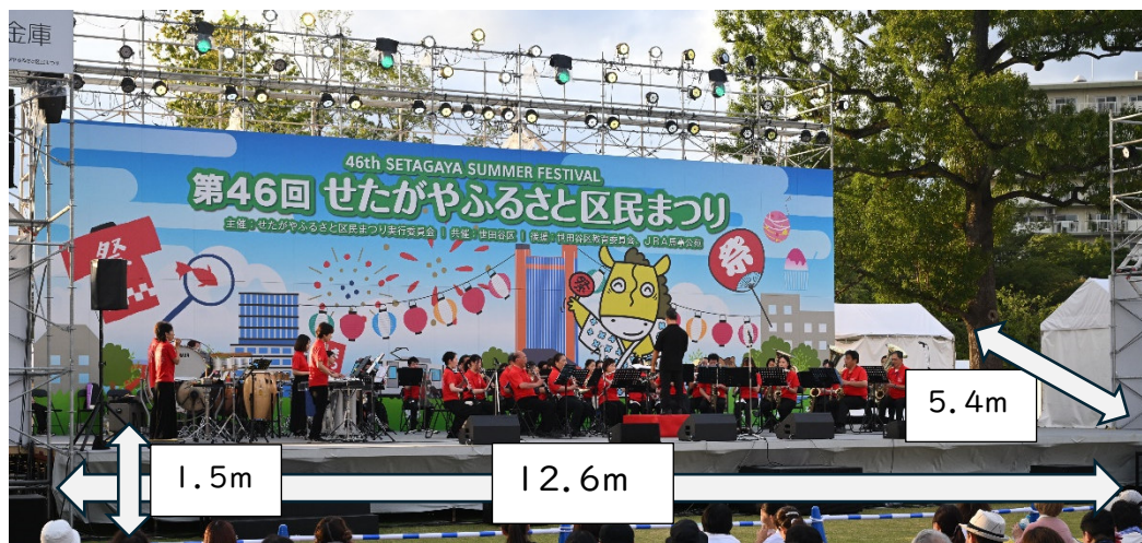
【はらっぱステージ】

※写真は第46回時のものです。はらっぱステージは、ステージの仕様・配置が大きく変更(※)になります。