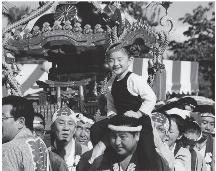
おみこし連合行進と太鼓の響演