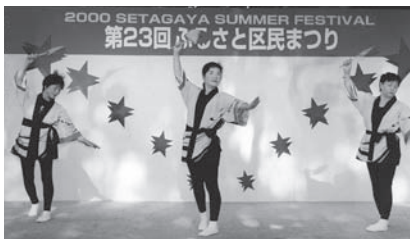
郷土民踊飯田よいとこ (長野県飯田市)