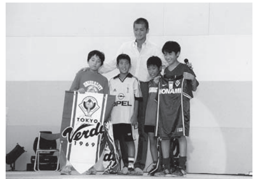
エフエム世田谷イベント