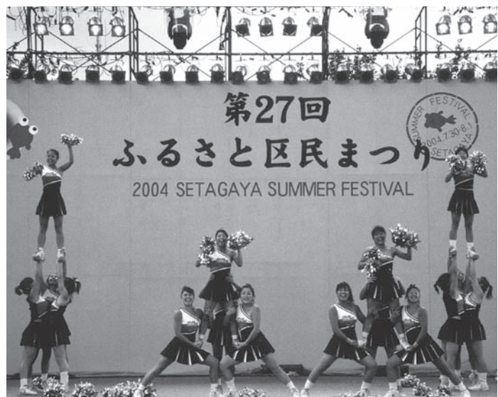
チアダンス・チアリーディング