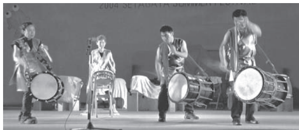
前夜祭 サルサと和太鼓のコラボレーション