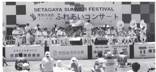
東京の消防 119年ふれあいコンサート