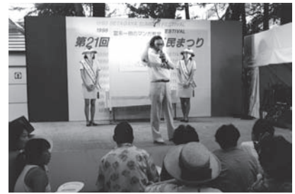
富永一朗まんが教室