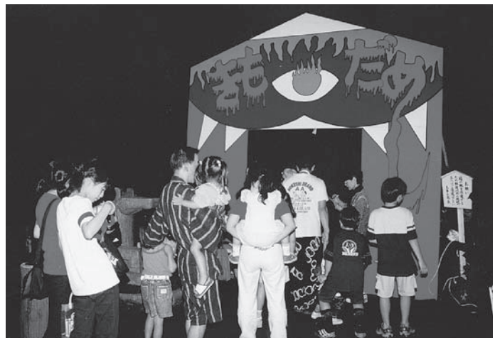
子どもコーナー(きもだめし)