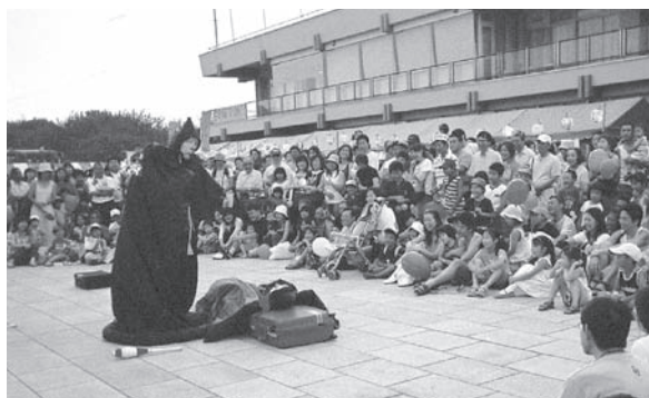
ヘブンアーティストの大道芸