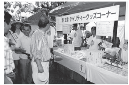
堺正章チャリティーグッズコーナー