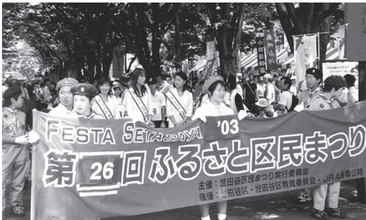
オープニングパレード