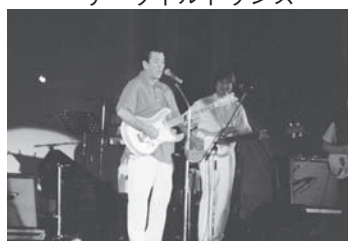
26回 加山雄三 with 加瀬邦彦 & ザ・ワイルドワンズ