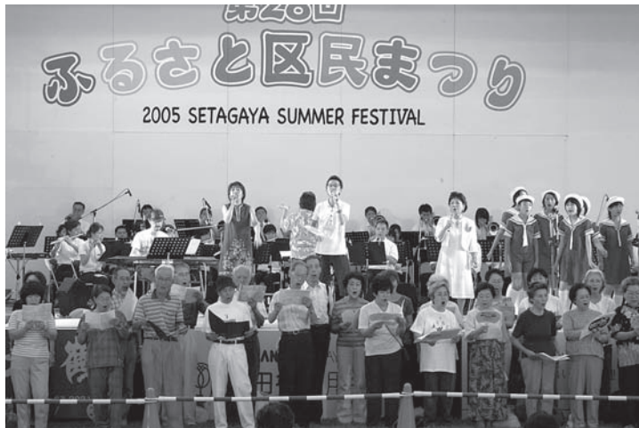
せたがやの歌発表