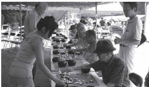
囲碁・将棋コーナー