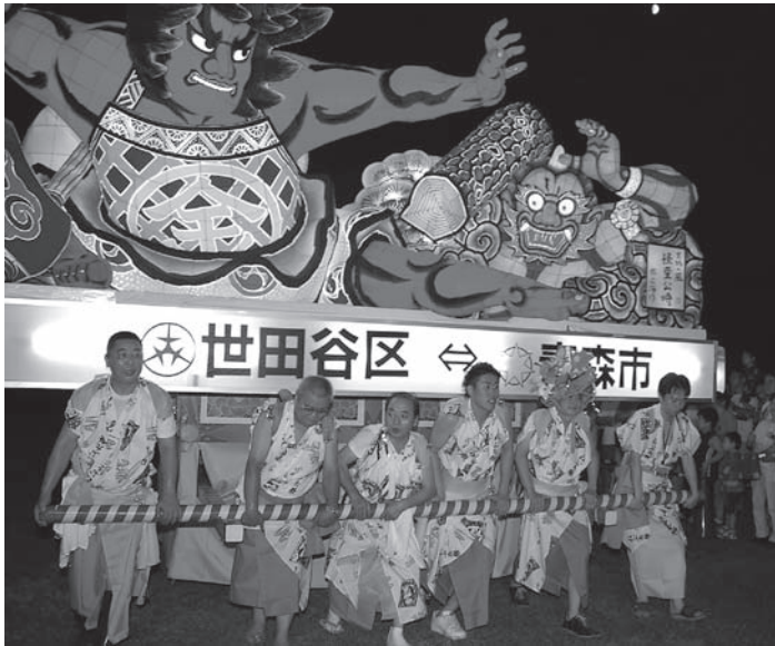
せたがや踊りざん舞！（ねぶた運行）