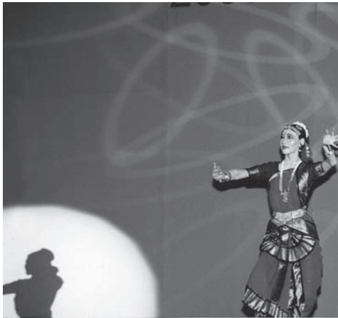
南インド古典舞踊