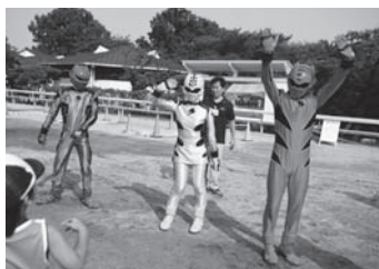
30回 「獣拳戦隊ゲキレンジャー」ショー