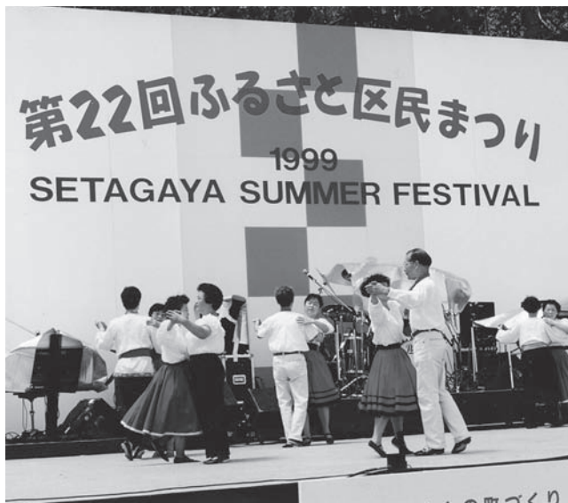
みんなで踊ろう 世界のフォークダンス