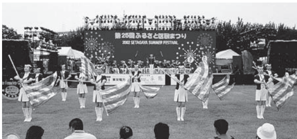
オープニングパレード