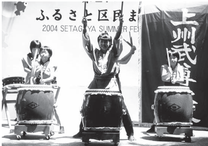
上州武尊太鼓（群馬県川場村）