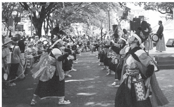
中野流鶺鴒七頭舞(岩手県普代村)