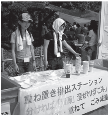
ごみステーション