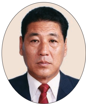
世田谷区民まつり 実行委員長