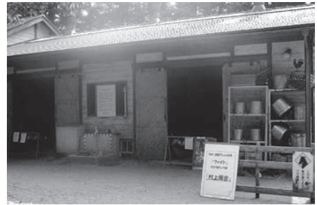
NHKドラマ「ファイト」セット