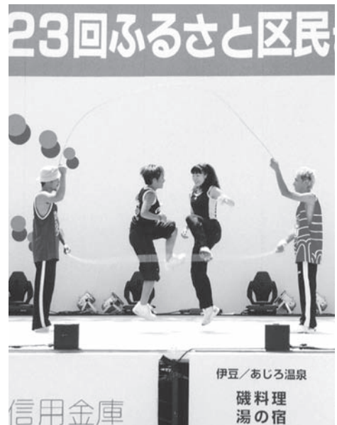
ダブルダッチスペシャル