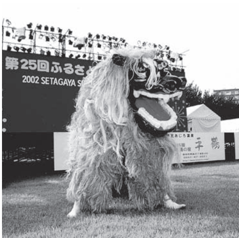
琉球國祭り太鼓～迎恩の舞～(沖縄県平良市)