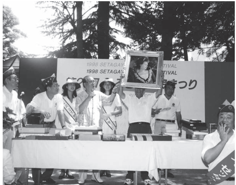
チャリティーオークション