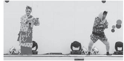
くまもと in 世田谷 (熊本県熊本市)