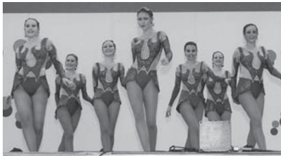
ジャズバレエ (オーストラリア・バンバリー市)