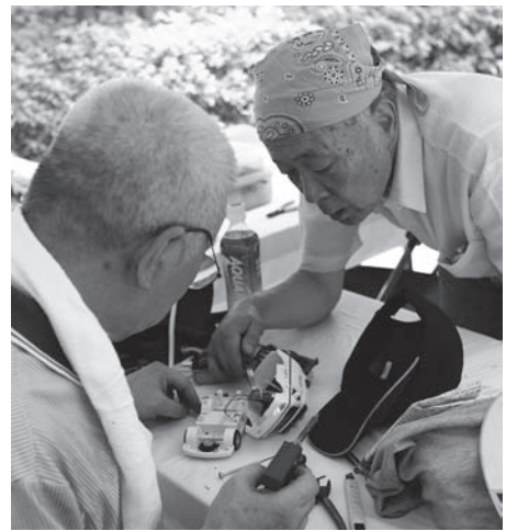
清掃・リサイクルコーナー（おもちゃの診療所）