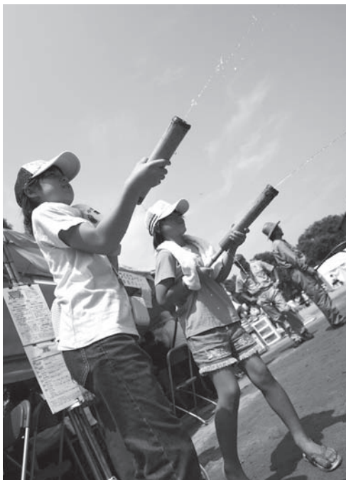
清掃・リサイクルコーナー