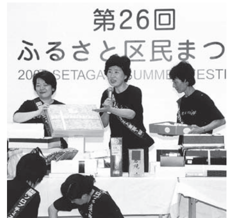
チャリティーオークション