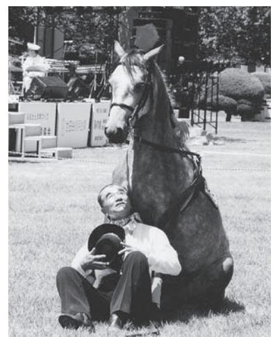
ポニーの演技・軽乗演技