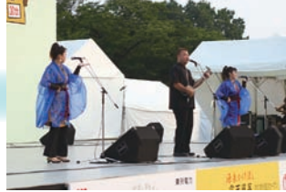
宮古島島唄ライブ