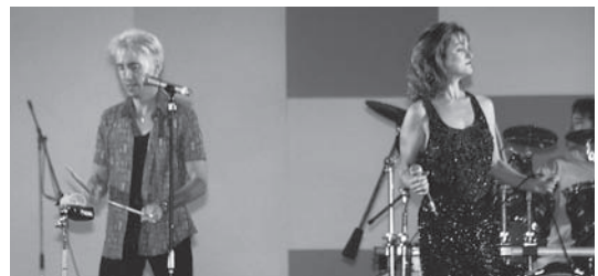
ビッグ・バンド・ジャズ