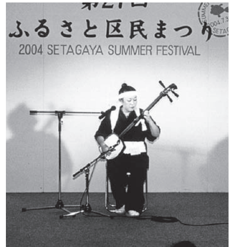
津軽三味線（青森県浪岡町）