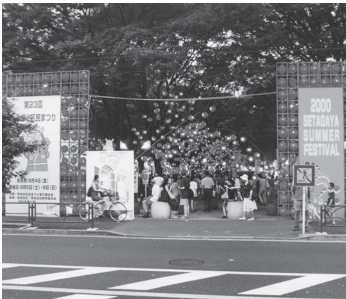
並木広場ディスプレイ