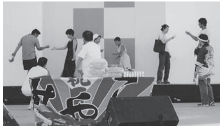
観光物産〇×クイズ（岩手県宮古市）