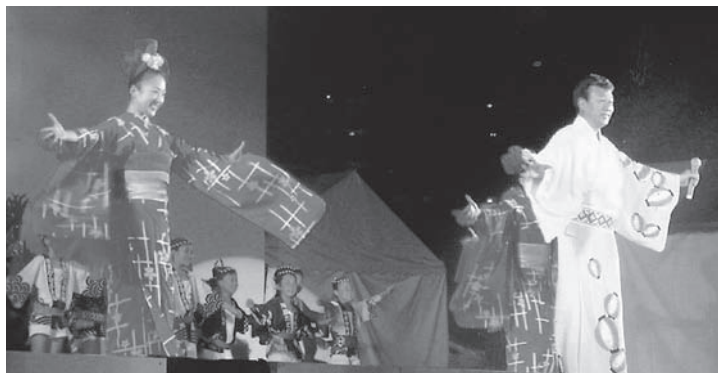
せたがや踊りざん舞!(みんなで踊ろう盆ダンス!~橋幸夫~)