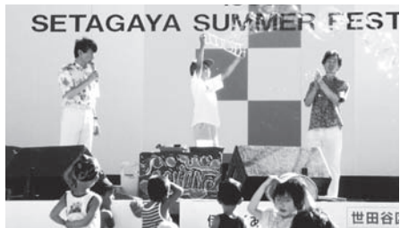
杉山兄弟スーパーシャボン玉ショー