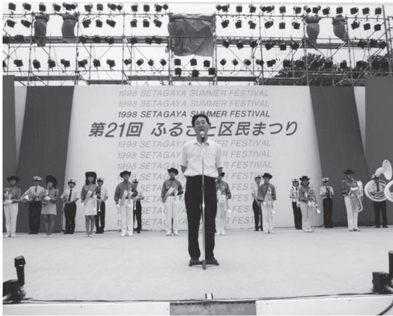
開会宣言・主催者あいさつ