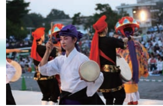
宮古島市伝統芸能