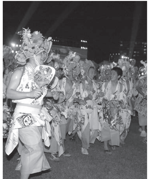
せたがや踊りざん舞！（ねぶた運行）