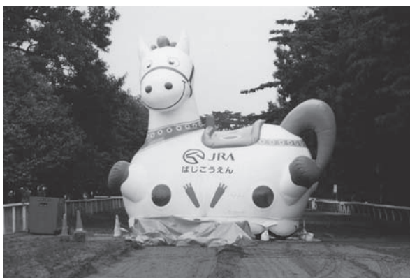
ふわふわトランポリン