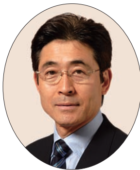
世田谷区議会議員 大場 やすのぶ