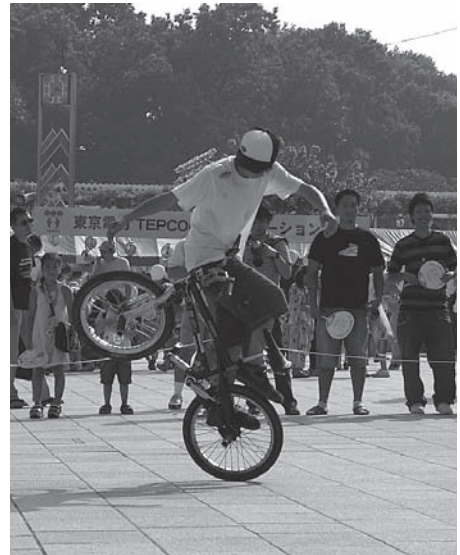
BMXフリースタイルショー