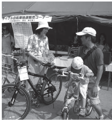
清掃・リサイクルコーナー