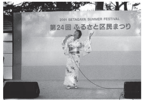
ふるさとの歌 "三軒茶屋音頭"