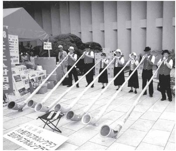
八ヶ岳アルプホルンクラブ・玉川アルプホルンクラブ