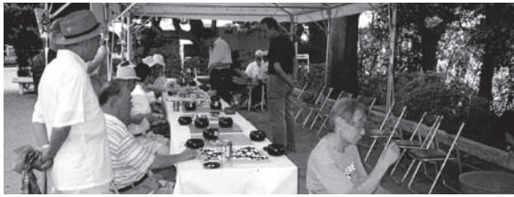
囲碁・将棋コーナー