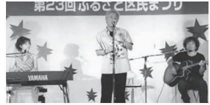
東京世田谷ライオンズクラブミニコンサート