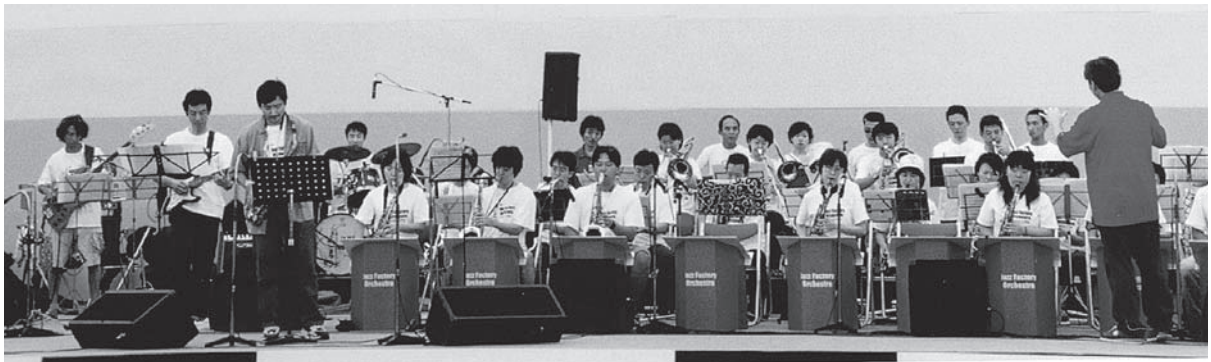
これがビッグバンドだ!!