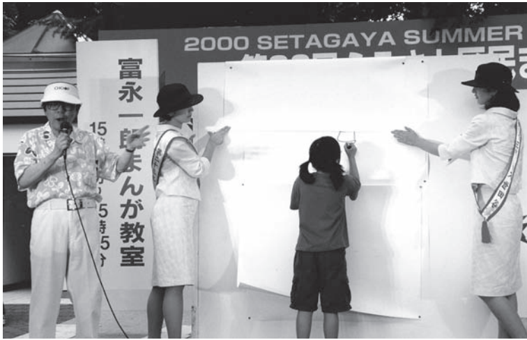
富永一朗まんが教室