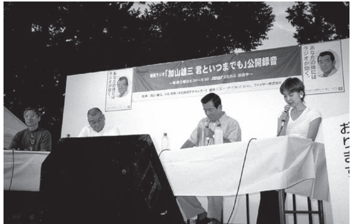
文化放送公開録音 加山雄三 君といつまでも (メインスクエア)