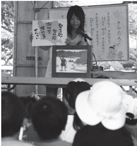
昔あそびコーナー（紙芝居）