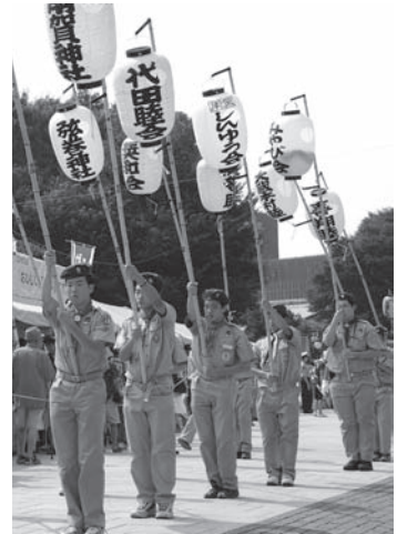
おみこし連合行進（ボーイスカウト）