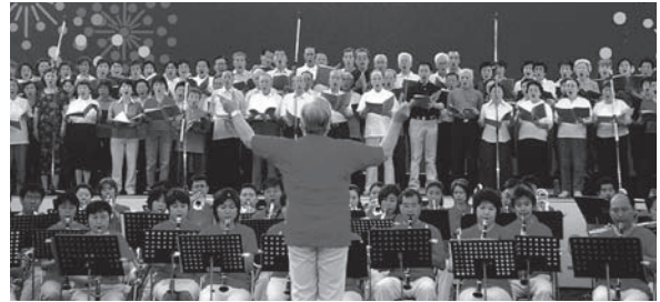
世田谷区民吹奏楽団&世田谷区民合唱団