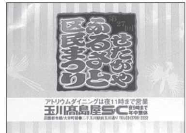
ポケットティッシュ広告