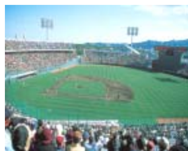
サンマリスタジアム宮崎

平成18年1月1日に隣接する佐土原町・田野町・高岡町と合併し、今年3月23日には更に清武町を加えた新「宮崎市」は「太陽と緑」に象徴される温暖な気候と宮崎市生目の杜運動公園・アイビススタジアムなどの充実した施設を活用し、2月にプロ野球とJリーグの春季キャンプが行われます。また、秋にはプロゴルフのビッグトーナメントやプロ野球の秋季教育リーグが開催されます。