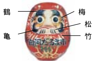
顔に鶴・亀・松竹梅が描かれている